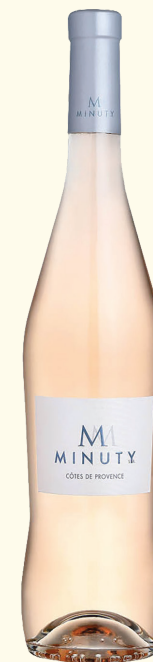
CUVÉE M CHÂTEAU MINUTY AOP CÔTES-DE-PROVENCE