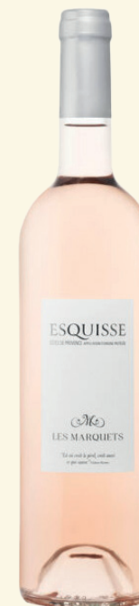
ESQUISSE DES MARQUETS AOP CÔTES-DE-PROVENCE

Un pur produit de l'appellation, bien fait et cohérent. Les notes délicates d'agrumes sont particulièrement fraîches.