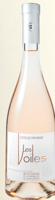
LES VOILES DE ST TROPEZ AOP CÔTES-DE-PROVENCE