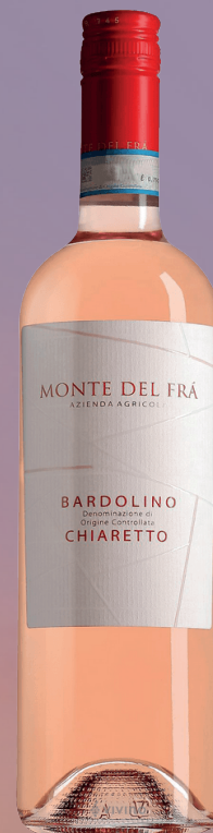
MONTÉE DEL FRA CHIA- RETTO DI BARDOLINO DOC CHIARETTO DI BARDOLINO