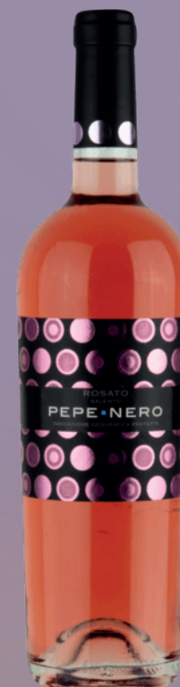
PEPE NERO ROSATO NEGROAMARO IGP SALENTO

Robe saumon clair, nez fruité. Parfums de fruits des bois et de pomme. En bouche, belle fraîcheur, élégant et fin.