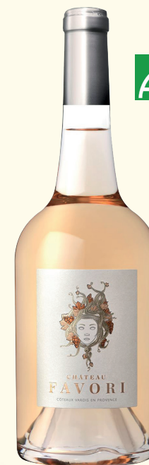
CHÂTEAU FAVORI AOP CÔTEAUX VAROIS EN PROVENCE

Nez intense sur les fruits exotiques. Une bouche longue et ample. Finale rafraichissante.