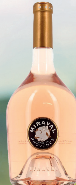
CHÂTEAU MIRAVAL AOP CÔTES-DE-PROVENCE

Grenache et Cinsault se marient dans cette cuvée pour vous offrir une bouche délicate accompagnant de jolies notes florales.