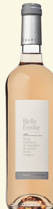
BELLE EMILIE IGP GARD

Un vin délicat, subtil, qui est dans le haut de gamme qualitatif de ce qu'on peut trouver sur cette appellation.