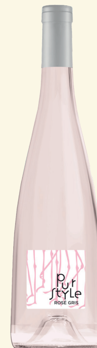
ROSÉ GRIS PUR STYLE IGP MÉDITERRANÉE

DÉGUSTATION Ce rosé donne envie d'être au bord de la plage pour le déguster. Son équilibre entre acidité et amertume en fond un vin consensuel.