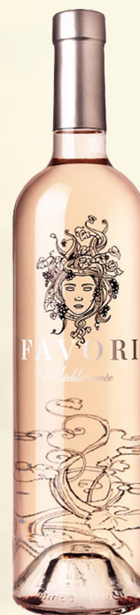
FAVORI IGP MÉDITERRANÉE