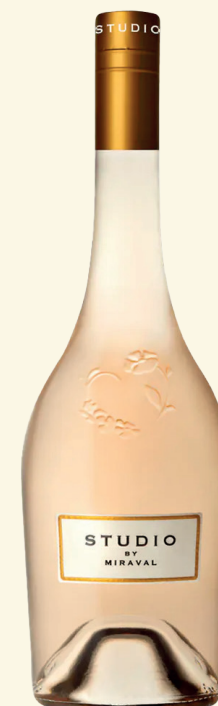
MIRAVAL STUDIO IGP MÉDITERRANÉE

DÉGUSTATION Un joli rosé grist reconnaissable à sa belle robe rose et à sa fraîcheur en bouche, révélant des notes fruitées et florales.