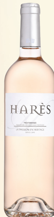
HARES IGP MÉDITERRANÉE