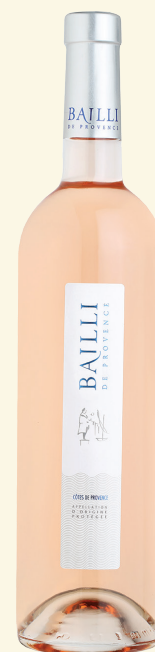
BAILLI DE PROVENCE MAISON GILARDI AOP CÔTES-DE-PROVENCE