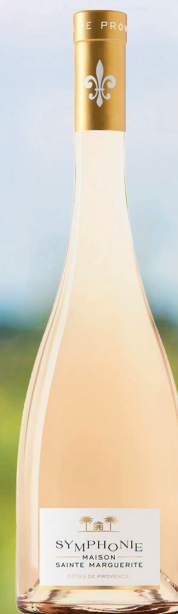
STE MARGUERITE SYMPHONIE AOP CÔTES-DE-PROVENCE