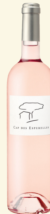
CAP DES ESPERELLES IGP VAR

Au nez, des notes de cassis, framboises, fraises. Bouche fruitée et friande marquée par les petits fruits rouges.